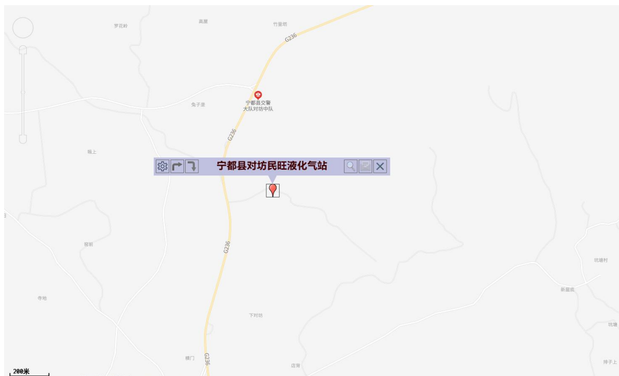
图 2.3-1 企业地理位置图