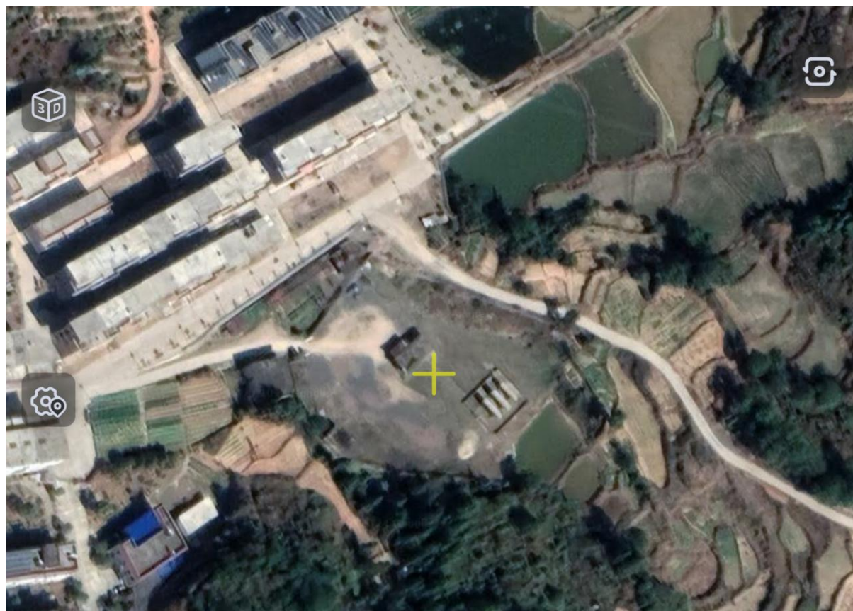
图 2.3-2 企业卫星定位图